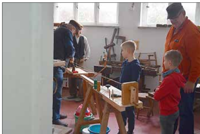
Während der Ferienspiele kommen gern Grundschüler ins Museum.

Wann: 2. Juni 2026, 14.00 - 18.00 Uhr Wo: Souterrain des Trend Hotels Banzkow