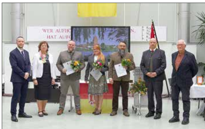
Unsere Umweltpreisträger 2025