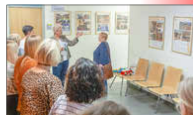
Mitglieder der DAZ e.V. eröffnen die Ausstellung für Besuchende

digkeiten und Abläufen in der Verwaltung. Besonders für junge Besucherinnen und Besucher gab es die Möglichkeit sich über die Berufsausbildung im Amt Crivitz bzw. über ein duales Studium zu informieren – hier konnten sie sich über Einstiegsmöglichkeiten und Ausbildungswege in der Kommunalverwaltung informieren. Das Amt Crivitz bedankt sich bei allen Gästen und freut sich über die positive Resonanz zur Veranstaltung.