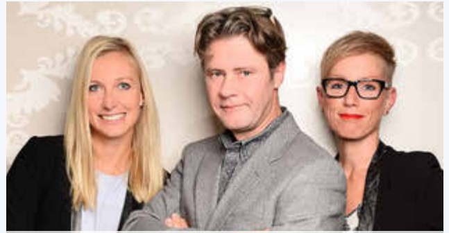
Kreativ, geduldig, stressresistent.

Der Zahntechniker stellt Inlays, Kronen, Brücken, Prothesen und kieferorthopädische Geräte aus den unter-