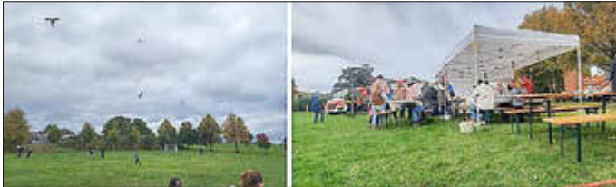
Drachenfest in Görslow

Bei zünftigem Herbstwetter ließen am 12. Oktober etwa 100 Kleine und Große beim „Drachenfest“ auf dem Sportplatz in Rampe ihre Drachen fliegen.