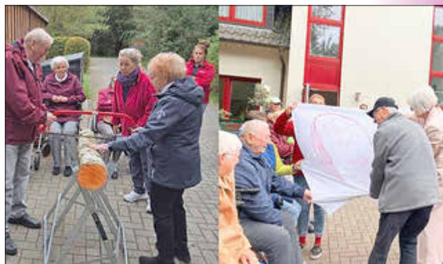
Das symbolische Baumstammsägen und das Herzausschneiden wird durch Tagespflegegäste durchgeführt

Seit dem 26. September sind damit alle Tagesgäste, Angehörigen und Mitarbeitenden vereint unter einem Dach in der Johanniter-Tagespflege Plate – ein starkes Signal für Miteinander, Gemeinschaft und Zukunft.