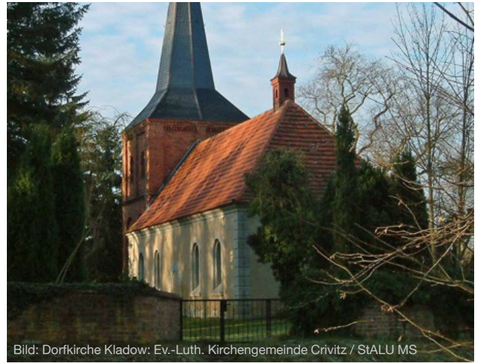
Dorfkirche Kladow

Die Dorfkirche Kladow ist nicht nur ein bedeutendes Kulturdenkmal der Region, sondern auch ein Ort der Begegnung, Besinnung und Geschichte. Besucher sind jederzeit willkommen, sich über die Kirche und ihre bewegte Historie zu informieren.