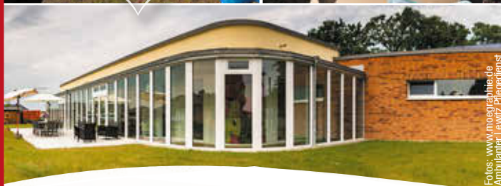
Ambulanter Lewitz Pflegedienst

Zuhause bleiben, solange es geht - das ist der Wunsch der meisten Menschen.