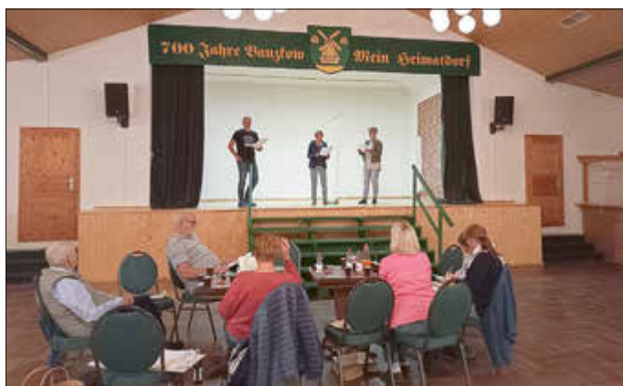
Jeden Dienstag wird kräftig geprobt und Text gelernt.