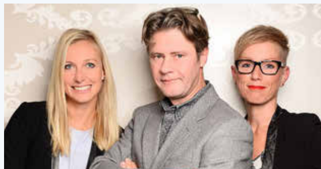
Kreativ, geduldig, stressresistent.

Der Zahntechniker stellt Inlays, Kronen, Brücken, Prothesen und Kieferorthopädische Geräte aus den unter-