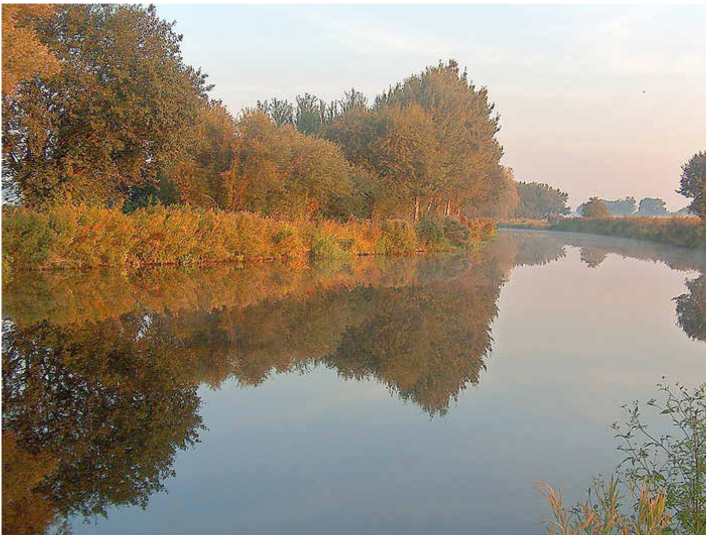
Die Stör bei Banzkow in bunten Herbstfarben

Mitteilungsblatt mit amtlichen Bekanntmachungen des Amtes Crivitz und seiner Kommunen aufgrund von Vorschriften des Baugesetzbuchs