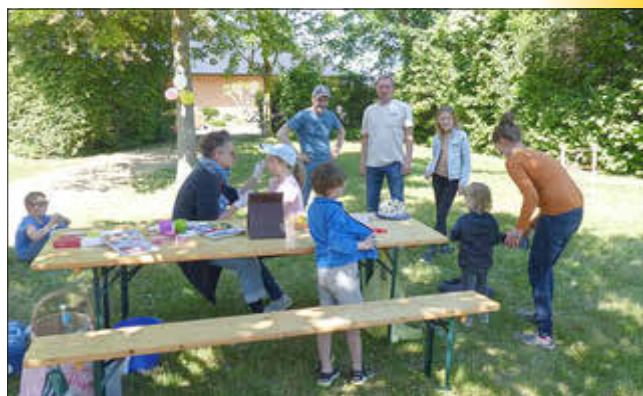
Kinderschminken beim Spielplatzfest

Bei Musik, Kuchen und Getränken wurde gespielt, be- und gemalt, getanzt und gelacht.