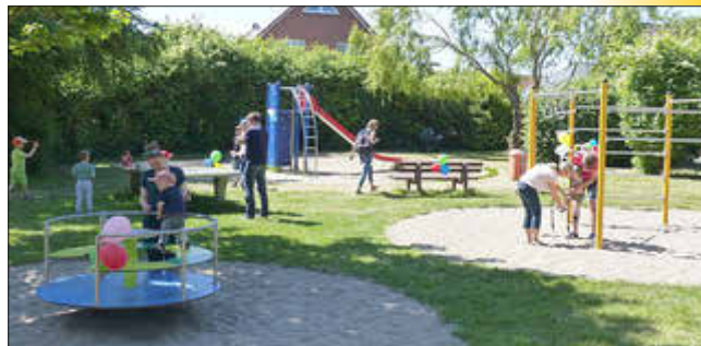
Kinderfest im Blumenviertel

Am 3. Juni war auf dem Spielplatz im Rosenweg in Leezen (endlich einmal) etwas los! Bei strahlendem Sonnenschein und mehr als 20 Grad begrüßten neben den kürzlich errichteten zusätzlichen Spielgeräten Luftballons und Seifenblasen sowie weitere Überraschungen die kleinen und großen Besucher des ersten Spielplatzfestes zu Ehren des Kindertages.