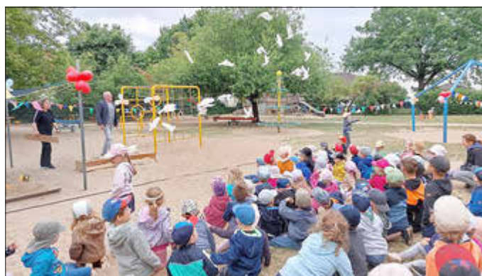
30 Friedenstauben starten vom Kitaspiegelplatz in den Himmel