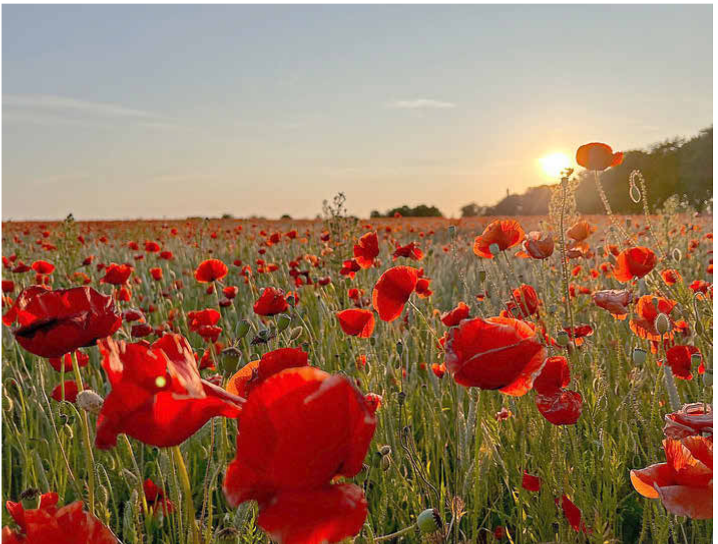
Mohnblumen bei Leezen

Mitteilungsblatt mit amtlichen Bekanntmachungen des Amtes Crivitz und seiner Kommunen aufgrund von Vorschriften des Baugesetzbuchs