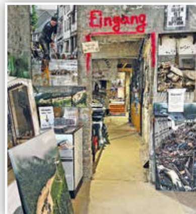
... die außer vielen Bildern auch mehrere Filmsequenzen beinhaltet.

AHRTAL. AFi. Auch fast zwei Jahre nach der verheerenden Flut ist das Ausmaß der Schäden entlang der Ahr weiterhin gegenwärtig. An vielen Stellen sieht es auf den ersten Blick noch immer nicht danach aus – doch es geht voran. Inhaber von Hotels, Restaurants und Geschäften haben, samt ihrer Mitarbeiter*innen, unzählige Stunden Arbeit, verbunden mit viel Hoffnung und Mut, in den Wiederaufbau ihrer geschäftlichen Existenzen gesteckt. Das Ziel: Endlich wieder zahlreiche Tages- und Übernachtungsgäste sowie Kundinnen und Kunden begrüßen zu können. Wanderfreudige Besucher*innen des Ahrtals dürfen sich, neben unvergesslichen Stunden in grandioser Natur entlang