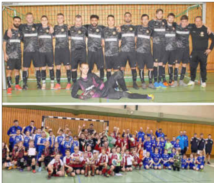
SV Sukow Herrenmannschaft und E-Junioren-Turnier