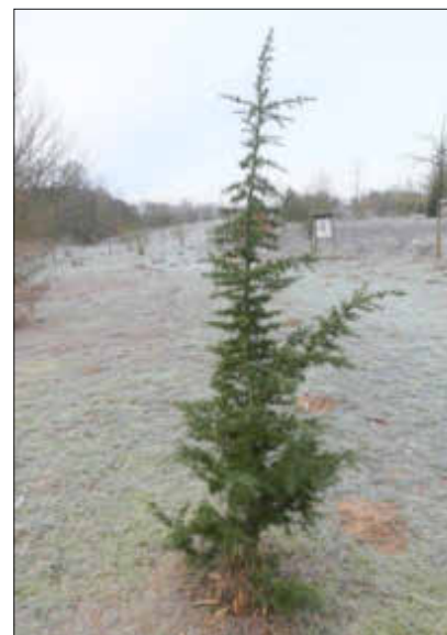
Libanon-Zeder im Arboretum

Die Libanon-Zeder gehört zur Familie der Kieferngewächse. Sie ist das Wahrzeichen in der Flagge Libanons. Die Libanon-Zeder ist ausgesprochen hitzeverträglich und hat nur geringe Nährstoffansprüche an den Boden. Mit ihrem geraden Wuchs und den guten Holzeigenschaften stellt sie eine Alternativbaumart zur Fichte da. In den letzten Jahren sind daher im Süden Deutschlands eine Reihe von Anbauversuchen durchgeführt worden. Aber auch in unserer Region sind erste Probepflanzungen mit der Libanon-Zeder erfolgt. Die Libanon-Zeder im Arboretum weist mit ihrem Wachstum auf alle diese zuvor genannten guten Eigenschaften hin.