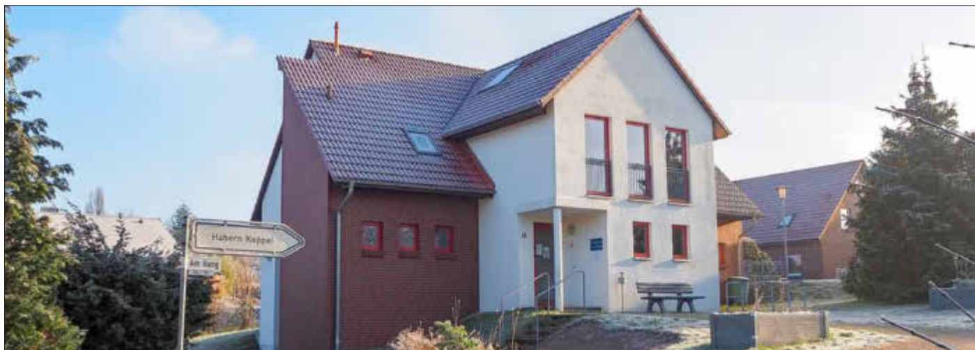
Feuerwehr und Gemeindehaus Gneven