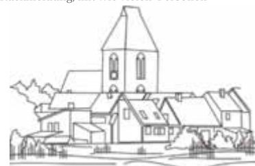
Britta Brusch-Gamm Bürgermeisterin