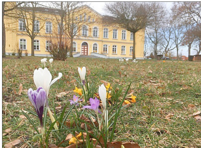
Frühling auf dem Schlossplatz