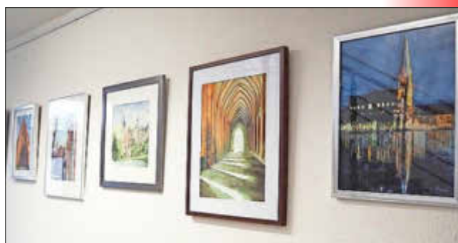
Aquarelle von Frau V. Güde